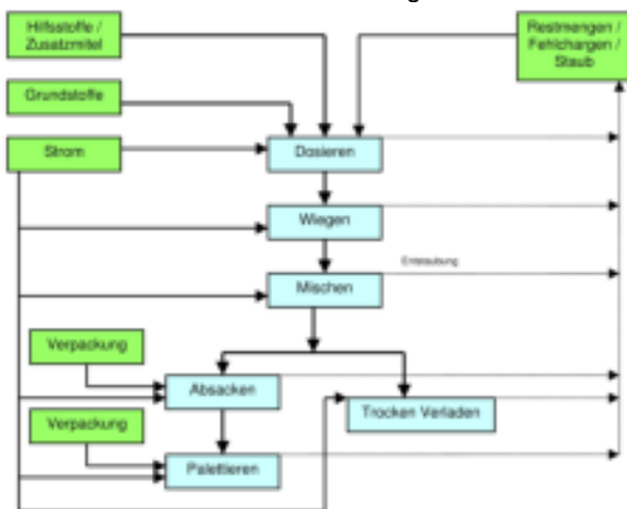
Graphik 1: Herstellungsprozess (grün: Input; blau: Einheitsprozess)

Die Rohstoffe – Sand, Bindemittel, Leichtzuschläge, Hilfsstoffe, Zusatzmittel und -stoffe (siehe Grundstoffe) – werden im Herstellwerk in Silos gelagert. Aus den Silos werden die Rohstoffe entsprechend der jeweiligen Rezeptur gravimetrisch dosiert und intensiv miteinander vermischt. Anschließend wird das Mischgut abgepackt und als Werk-Trockenmörtel trocken in Gebinden oder Silos angeliefert.